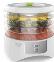
Food dryer AD 6654