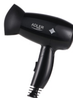
Hair Dryer AD 2251