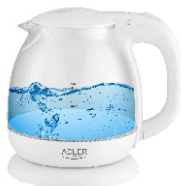
Water Kettle 1,0L AD 1283