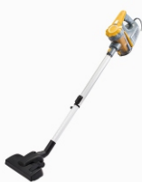
Bagless Vacuum AD 7036