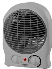
Fan Heater AD 7717