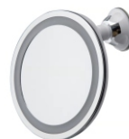
Led Bathroom Mirror AD 2168