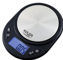
Precision scale AD 3162