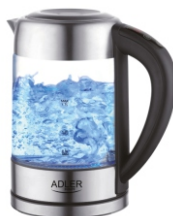
Water Kettle AD 1247 NEW