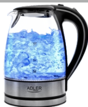
Electric Kettle AD 1225