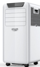
Air Conditioner AD 7916