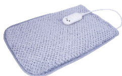
Electric heating pad AD 7415