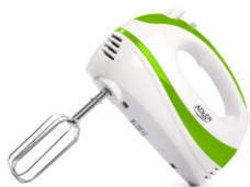
Mixer AD 4205