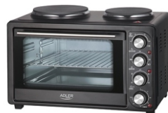
Electric Oven With HOB AD 6020