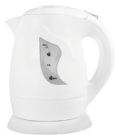
Electric Kettle AD 08