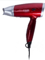
Hair Dryer AD 2220