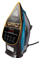
Steam Iron AD 5032