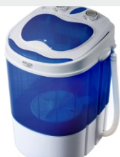
Mini washing machine with spinning function AD 8051