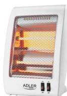
Quartz Heater AD 7709