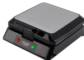
Waffle Maker AD 3036