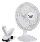
Desk fan 15 cm with clip AD 7317