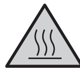
Uwaga! gorąca powierzchnia