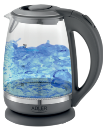
Kettle AD 1286