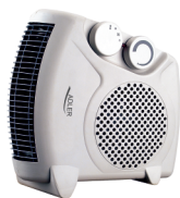
Diet Kitech Scale AD 3133