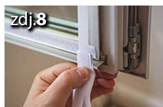
Połączyć końce taśmy, aby zapewnić pełne uszczelnienie