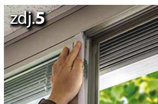
Nakleić dostarczoną taśmę samoprzylepną na ramę

Montaż taśmy samoprzylepnej oraz taśmy uszczelniającej