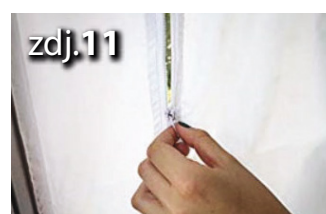
Rozepnij tkaninę uszczelniającą w celu umieszczenia rury wyrzutowej