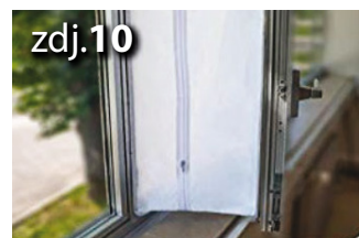
Wyrównaj obie strony. Upewnij się, że są one równomiernie rozciągnięte tak aby utworzyć szczelną powierzchnię