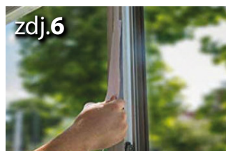
Nakleić dostarczoną taśmę samoprzylepną na ramę okna