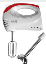
Mixer with blending shaft AD 4212