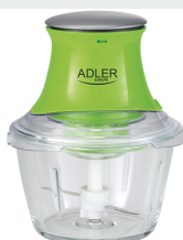
Chopper AD 4056