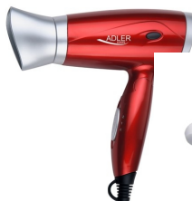
Hair dryer AD 2220