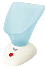
Facial sauna AD 2153