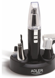
Trimmer AD 2907