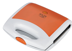
Waffle maker AD 3021