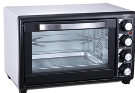
Electric Oven AD 6009